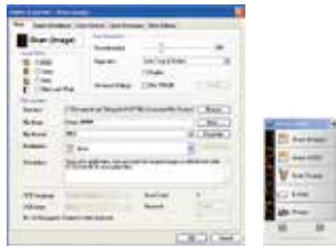
Pantalla principal de Button Manager V2

-Completa su digitalización con un solo paso