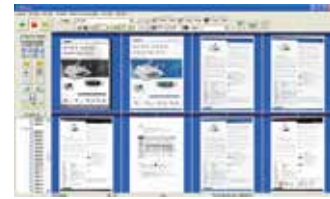
Pantalla principal de AVScan X

-La herramienta de administración de documentos inteligente