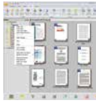
Pantalla principal de PaperPort SE14

- La elección profesional para organizar y compartir sus documentos